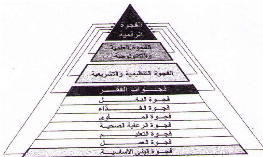
الشكل (١ : ١) الفجوة الرقمية: فجوة الضجوات

ويرى المهتمون ببرامج التنمية أن "المتغير المعلوماتي" هو "الفجوة الأم" تحمل جميع بذور التخلف المجتمعي وكل ما نجم عنه من فشل مشاريع إنمائية سابقة، وإذا أخذنا بعين الاعتبار تزايد اتساع الفجوة بين الأغنياء والفقراء بفعل المتغير المعلوماتي، نستطيع أن نتخيل التصدع الذي يعانيه المجتمع الإنساني بسبب الفوارق الرقمية فيما بين دول العالم، وتبرز كـفجوة مركبة تطفو كما يوضح الشكل (١)