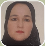
الباحثة فazole فازية جامعة أبو القاسم سعد الله الجزائر

تشخيص التلاميذ بطيئي التعلم من وجهة نظر المرشدين التربويين