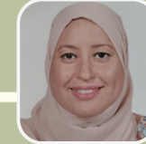
د. مhaw عقافية

فرضيات البحث العلمي: نماذج و شروط الصياغة